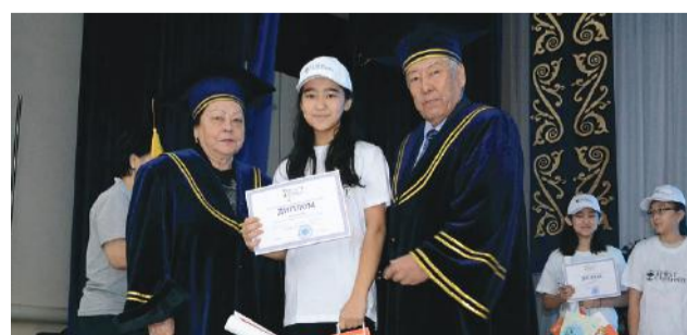
Балалар университеті - болашаққа бастар жол!